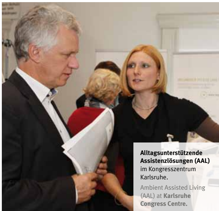
Alltagsunterstützende Assistenzlösungen (AAL) im Kongresszentrum Karlsruhe. Ambient Assisted Living (AAL) at Karlsruhe Congress Centre.

Der Megatrend demografischer Wandel rückt nach „Generation Y“ nun Senioren in den Mittelpunkt. Ihre Erfahrung und ihr Know-how nützen der Kongresswirtschaft.