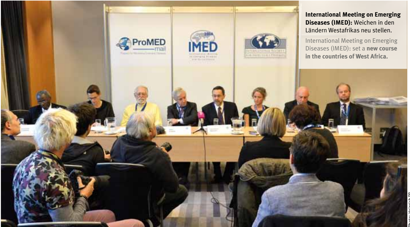
International Meeting on Emerging Diseases (IMED): Weichen in den Ländern Westafrikas neu stellen. International Meeting on Emerging Diseases (IMED): set a new course in the countries of West Africa.